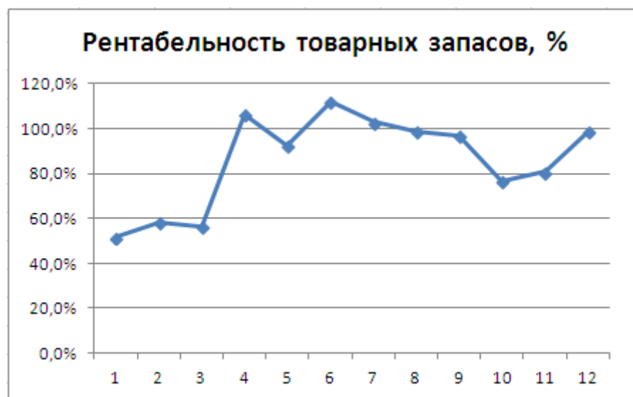
Рис. 1. Рентабельность товарных запасов

Диаграмма - один из способов графического изображения зависимости между величинами. Диаграммы составляются для наглядного изображения и анализа массовых данных. Диаграммы бывают разных видов: линейные, радиальные, точечные, плоскостные, объемные, фигурные. Вид диаграммы зависит от вида представляемых данных и задачи ее построения.